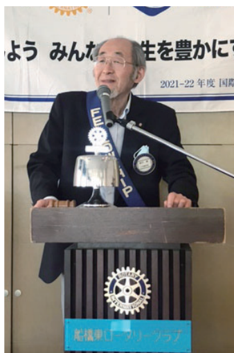
遠田会員、妻の誕生日卓話